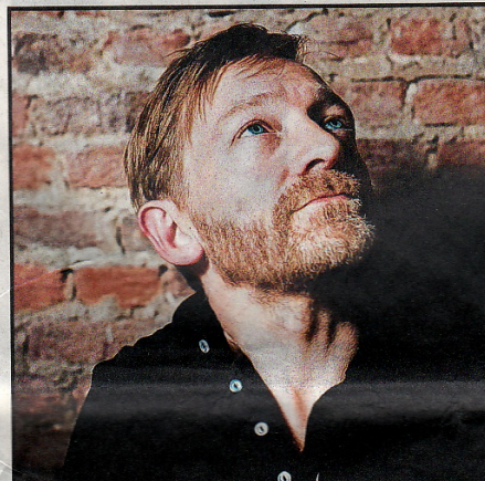
■ Borremans: "Ik laat het hart liever buiten beschouwing."