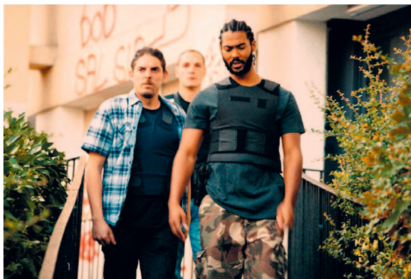
Les Misérables .

Naast een spraakmakende documentaire over die rellen gooide hij het ook over een vrolijkere boeg: met street-artist JR beplakte hij muren door heel Parijs met posters van gekkebekkentrekkende